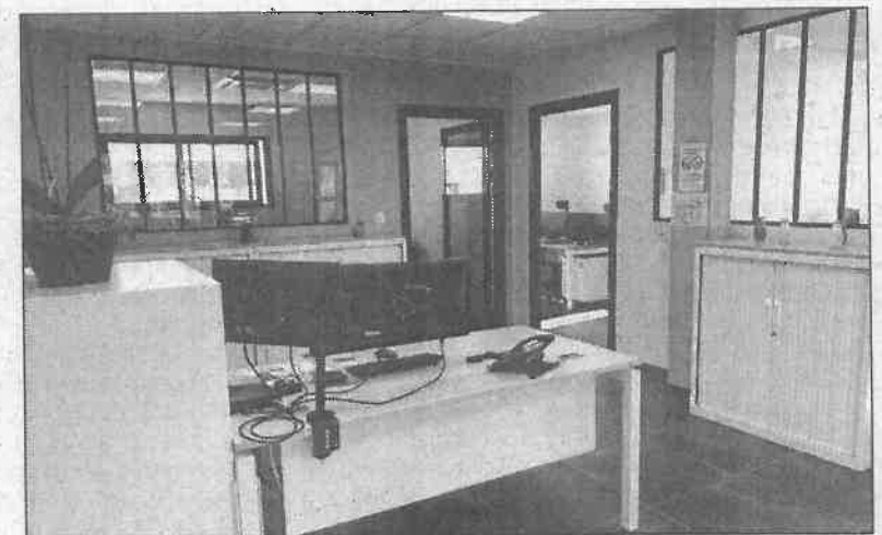
C'est en mars 2019 que ACDEF emménageait dans ses propres locaux situés en zone d'activité des Croisières.